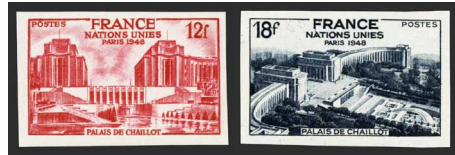
France - Poste - 818/819