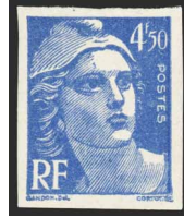
France - Poste - 718Aa