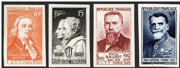
France - Poste - 844/47