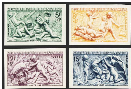
France - Poste - 859/62