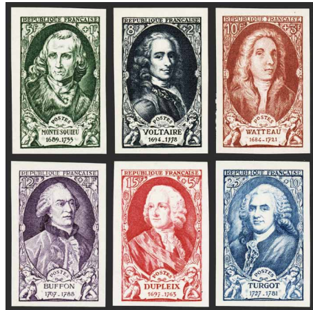
France - Poste - 853/58