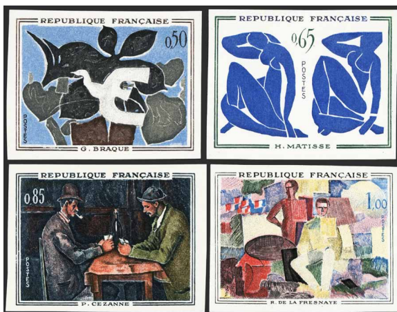
France - Poste - 1319-22